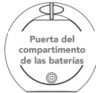
Relajador Sonoro, parte posterior